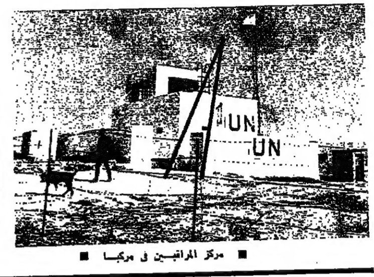
مركز المراقبين في مركبا